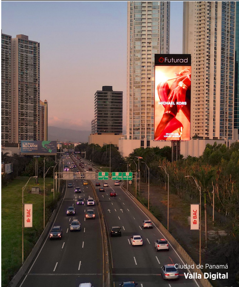
Ciudad de Panamá Valla Digital