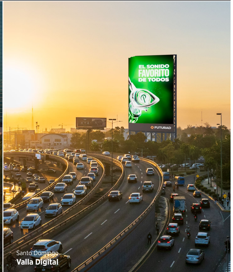
Santo Domingo Valla Digital