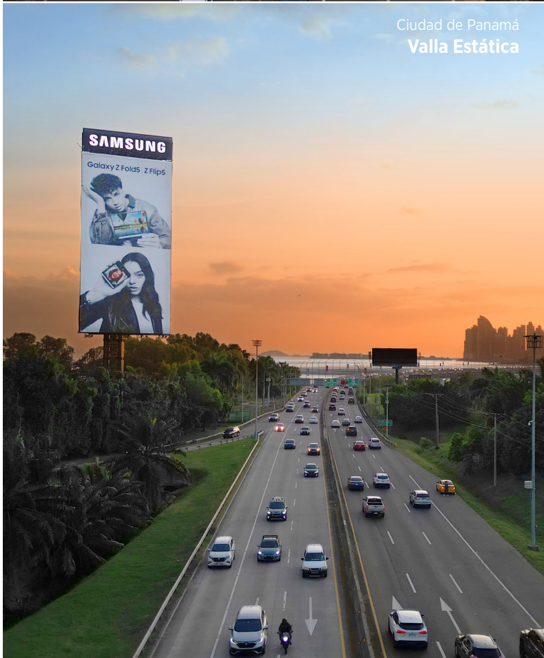
Ciudad de Panamá Valla Estática